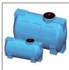
Model C horizontaal