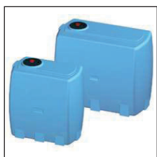
Model VA vertikaal