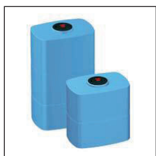
Model B0 vertikaal