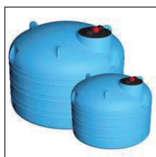
Model P vertikaal