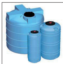
Model V vertikaal