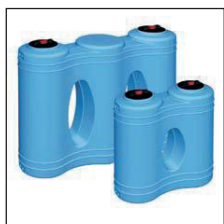
Model J horizontaal